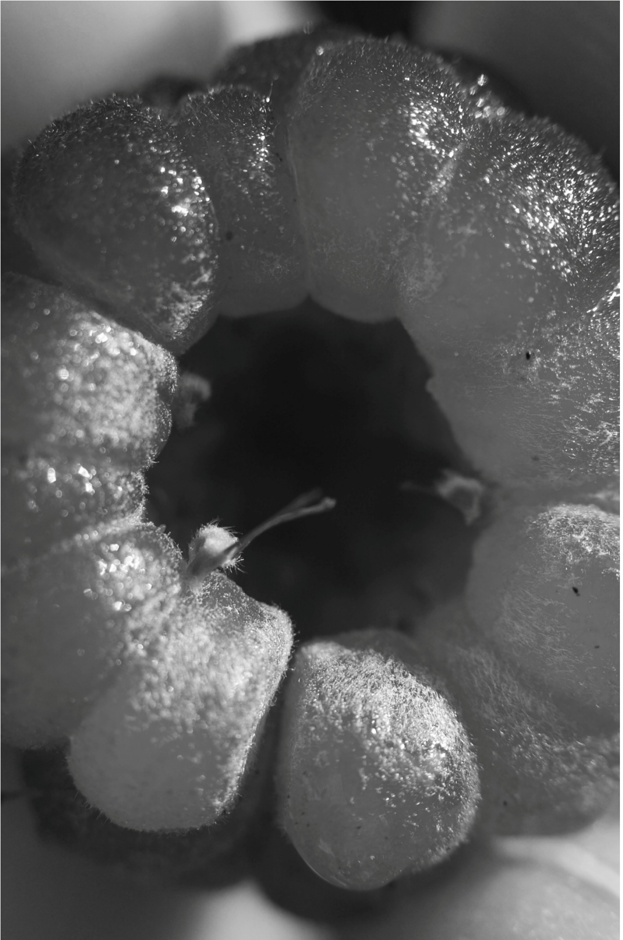
Photo 060. Raspberry/ Malina