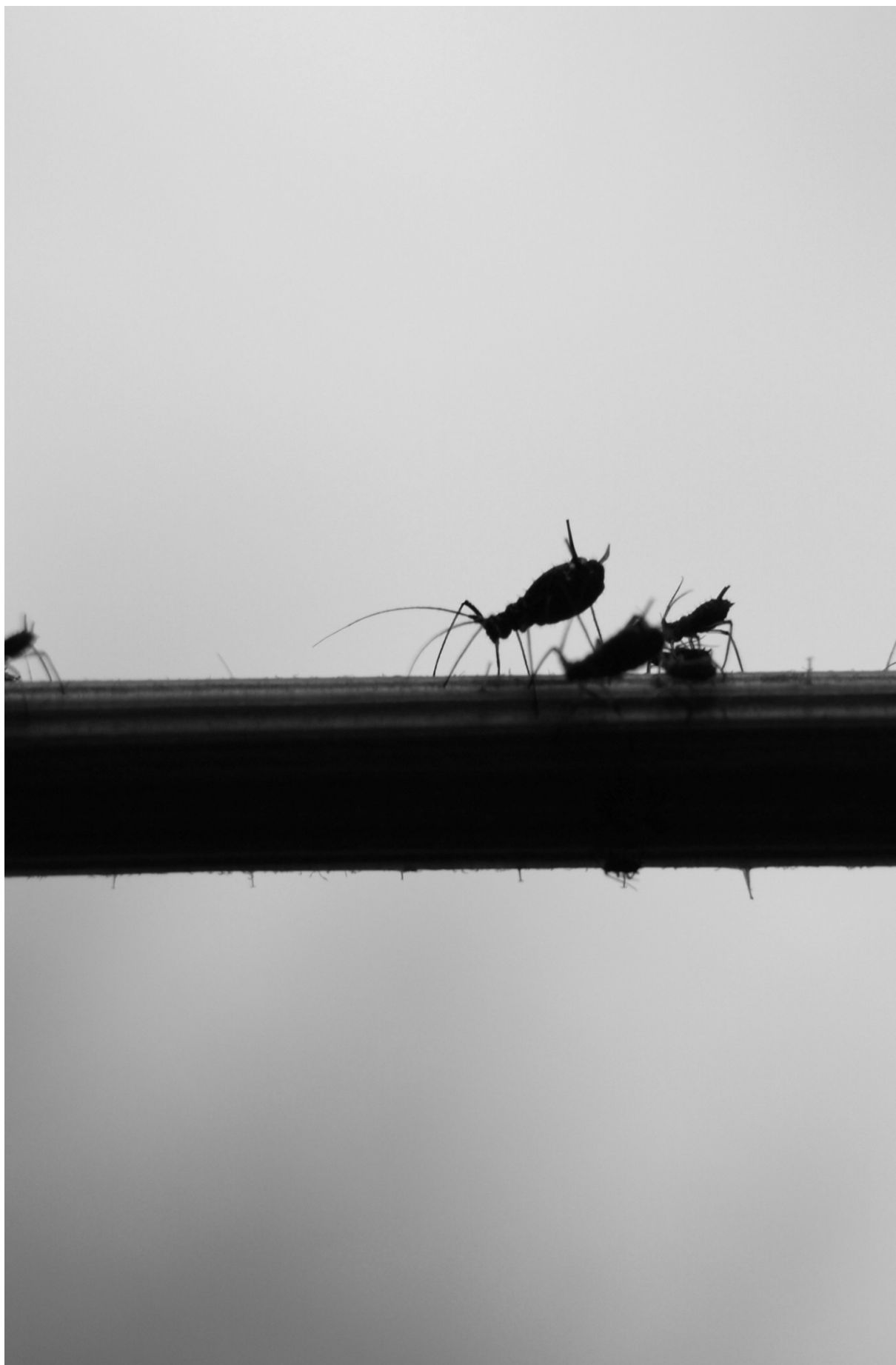
Photo 070. Aphid / Lisna uš