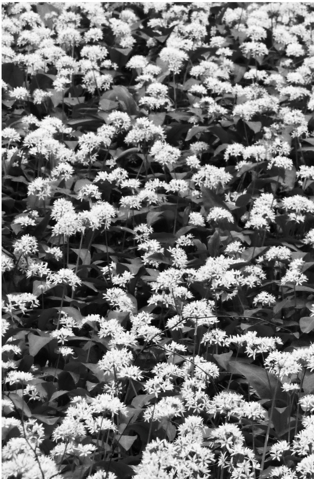
Photo 085. Field salad / Srimuš