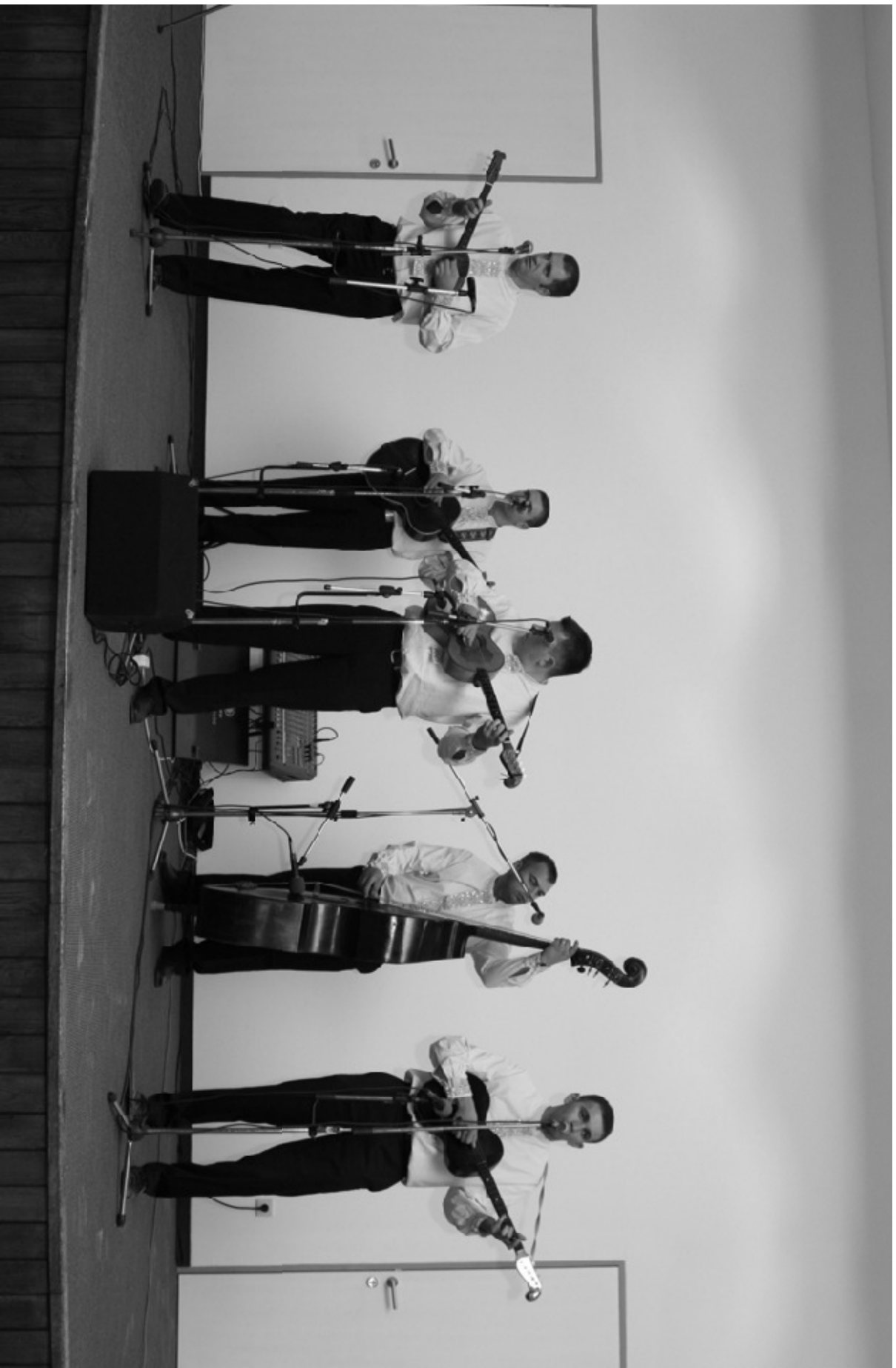
Photo 139. Tambura players / Tamburaši