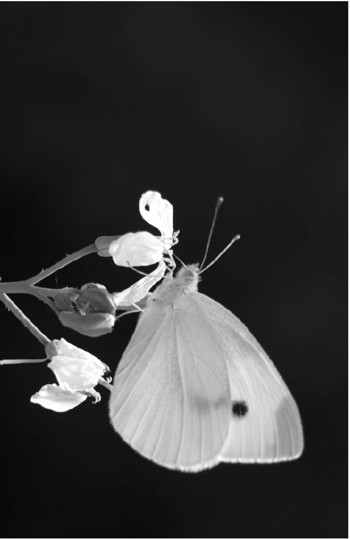
Photo 206. Butterfly / Lepidoptera