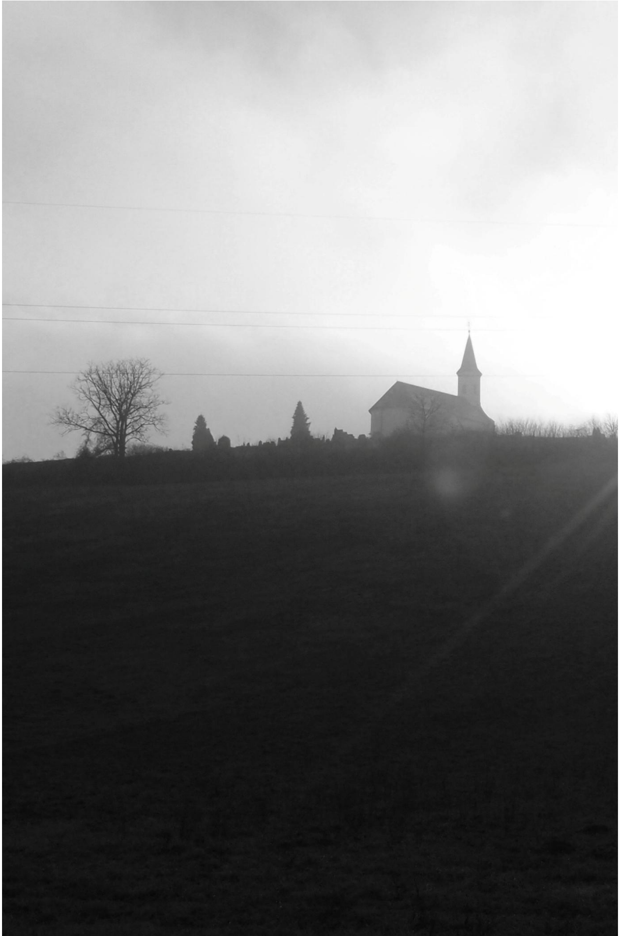
Photo 050. St. Martin / Sv. Martin