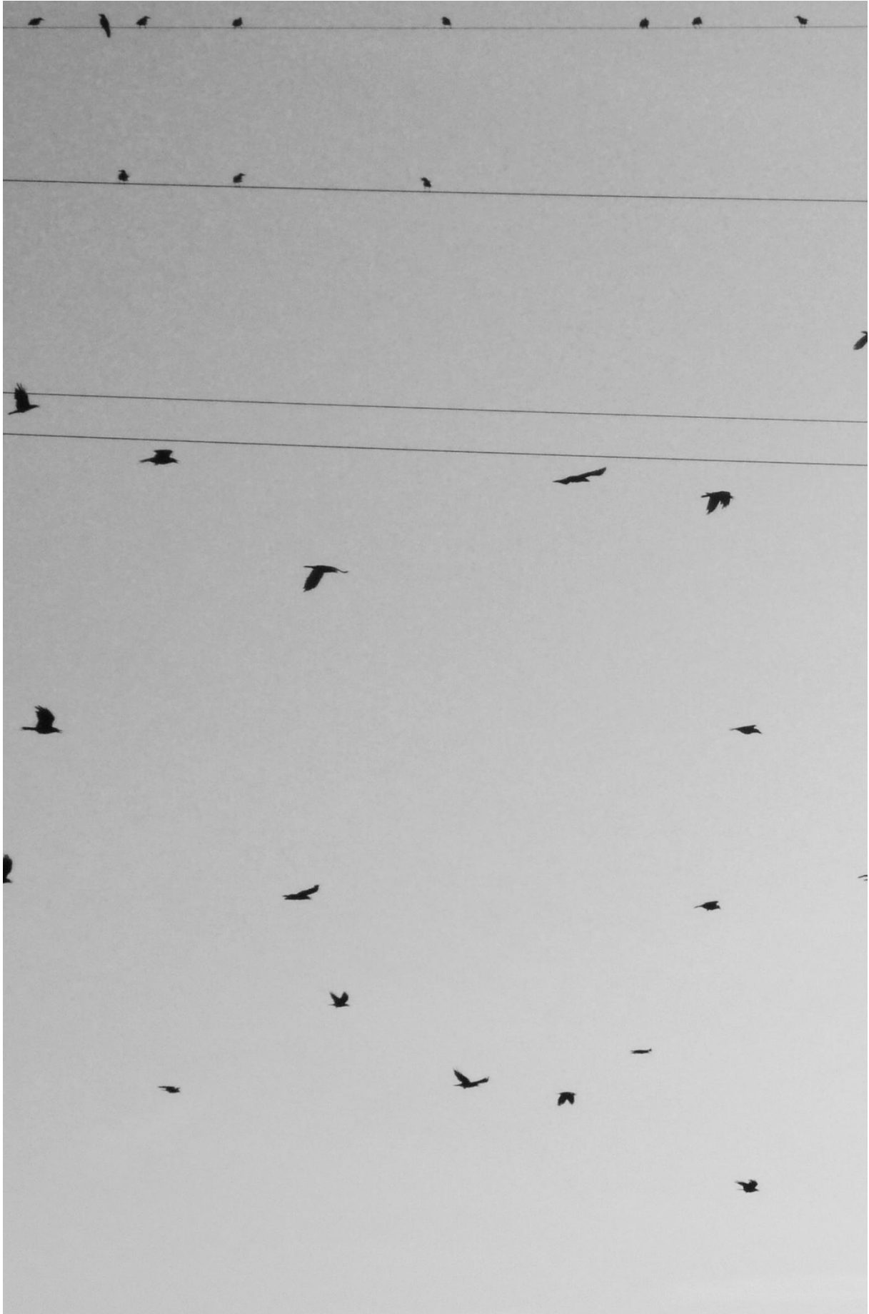
Photo 073. Birds / Ptice