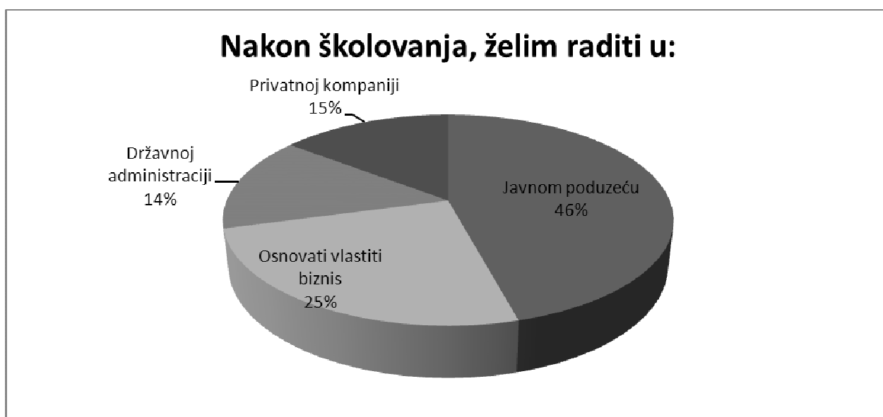
Slika 1. Istraživanje opredjeljenja budućeg radnog mjesta

Istraživanje je obuhvatilo posjetitelje web portala, sa najčešćom frekvencijom razreda godina od 18 do 25. Prema analizi Globalnog monitora poduzetništva ( Global Entrepreneurship Monitor ), za 2011. godinu, procenat onih koji bavljenje poduzetništvom smatraju poželjnim izborom karijere, raste iz godine u godinu u cijelom regionu, ali je procenat poduzetničkih namjera, odnosno ispitanika koji namjeravaju pokrenuti biznis u naredne tri godine, daleko ispod prosjeka grupe privreda kojima pripadaju. Ovo može da zabrinjava, naročito zbog visoke stope nezaposlenosti, kako u Bosni i Hercegovini, tako i u Republici Hrvatskoj. [3]