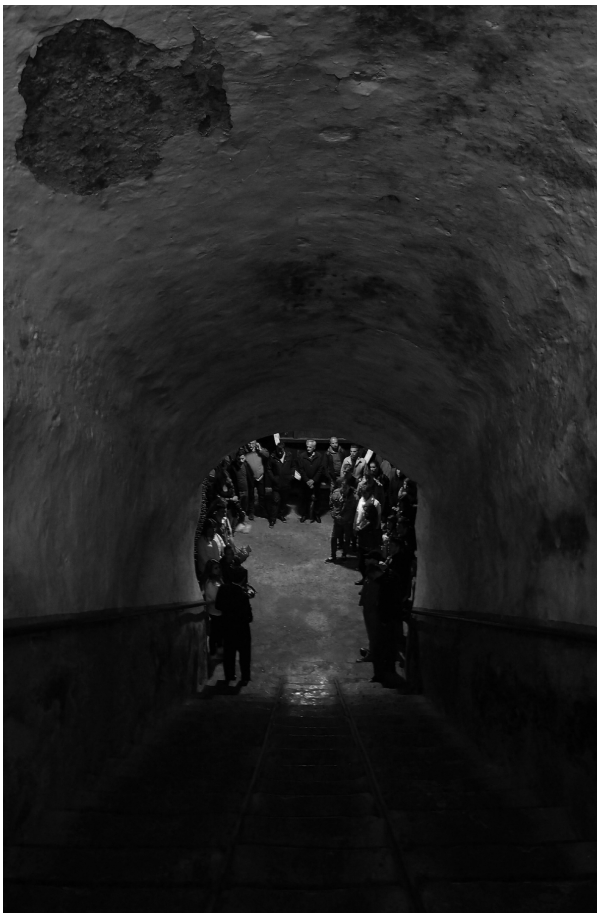
Photo 039. The entrance to the basement / Ulaz u podrum