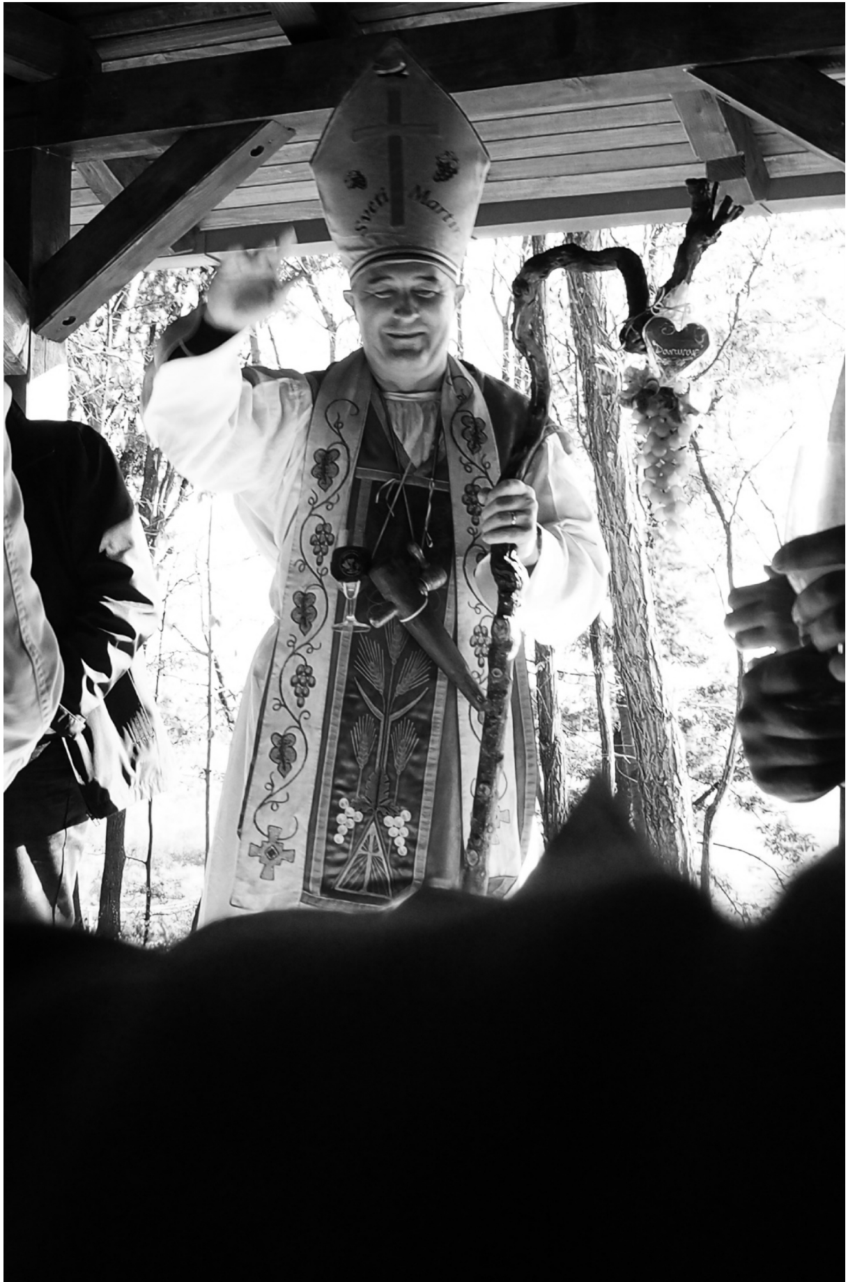
Photo 090. Martinje / Martinje