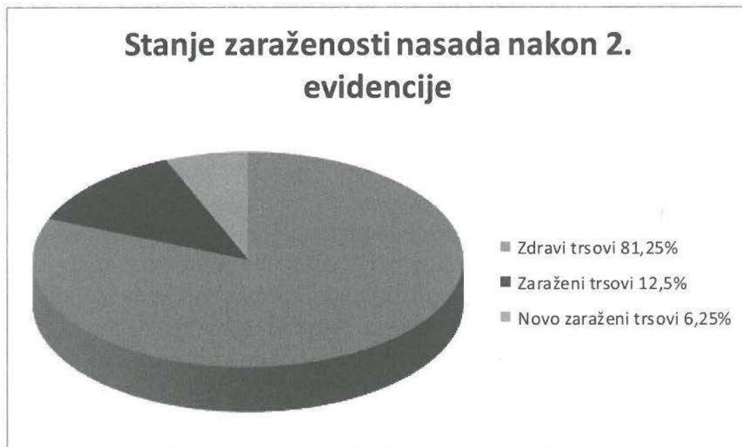
Grafikon 2. Stanje zaraze (%) nakon druge evidencije

Prilikom druge evidencije i kontrole saniranih trsova zabilježena je pojava 250 novo zaraženih trsova, a od 500 saniranih trsova 47 nakon sanacije ne pokazuju razvoj novih tumornih izraslina dok se na 453 trsa razvijaju nove tumornih izrasline usprkos provedenoj sanaciji.