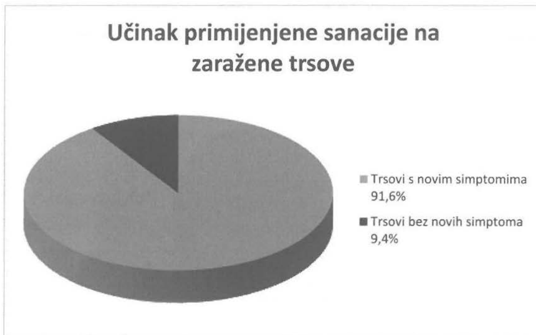
Grafikon 3. Učinak mjera sanacije

Grafikonom 3. prikazani su rezultati učinka sanacijskih mjera na 500 promatranih zaraženih trsova iz čega je vidljivo da 9,4% (47) tretiranih trsova ne pokazuje nove simptome zaraze dok 91,6% (453 trsa) pokazuje vidljive simptome zaraze odnosno novo zaraženo tkivo. Nakon sanacijskih mjera vizualnom procjenom pojave karakterističnih simptoma na 453 zaražena trsa više od 50% trsova pokazuje smanjeni porast tumornih izraslina uz malobrojne iznimke koje usprkos sanaciji ne pokazuju znakove smanjenja zaraze. Tijekom istraživanja nije provedeno detaljnije praćenje uroda grožđa obzirom je količina uroda ovisna i od ostalim čimbenicima uzgoja, iako na pokusnim trsovima vizualno nije primjetan manjak uroda grožđa bolesnih trsova u usporedbi sa zdravim.