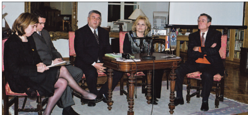
SL. 6. GODIŠNJA SKUPŠTINA HLZ PODRUŽNICE DUBROVNIK, SALOČA OD ZRCALA, 2002.