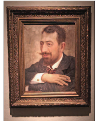
SL. 1. DR. MIHO PAPI, PORTRET VLAHA BUKOVCA IZ 1899. GODINE

Osnivanje udruge LUDO, kasnije preimenovane u DULIUD, predstavljalo je značajan pomak u radu liječnika na jugu Hrvatske. Njezin je rad bio usmjeren na stručno usavršavanje članova udruge, poboljšanje staleških pitanja, ali i na poticanje prijateljstva među kolegama i njihovim obiteljima. Članovi udruge bili su