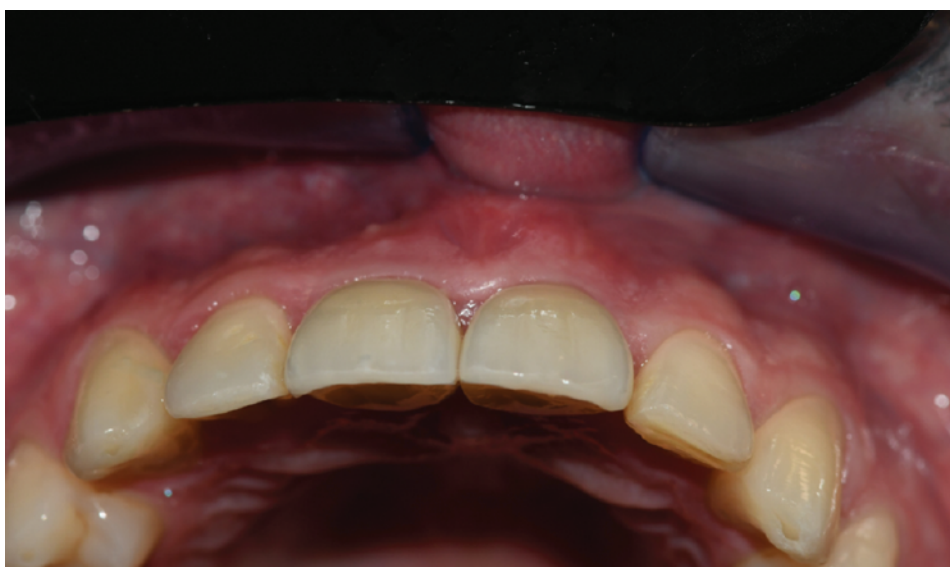
Slika 12. Okluzalni pogled – adekvatne dimenzije mekih i tvrdih tkiva oko krunica na implantatima.

vanja papila i adekvatnih kontura EBC zone (Slika 9.). Šest mjeseci od ugradnje nakon što su meka i koštana tkiva završila fazu remodelacije učinjeno je definitivno skeniranje i izrada trajnih pojedinačnih potpuno keramičkih krunica i to na način da je transgingivalni dio visokopolirani cirkon, a vestibularne plohe su slojevane („cut back“ tehnika.) (Slika 10.) Na kontroli godinu dana od postave trajnih krunica postignuta je i zadržana harmonija mekih i tvrdih tkiva oko postavljenih implantata (Slike 11. i 12.).