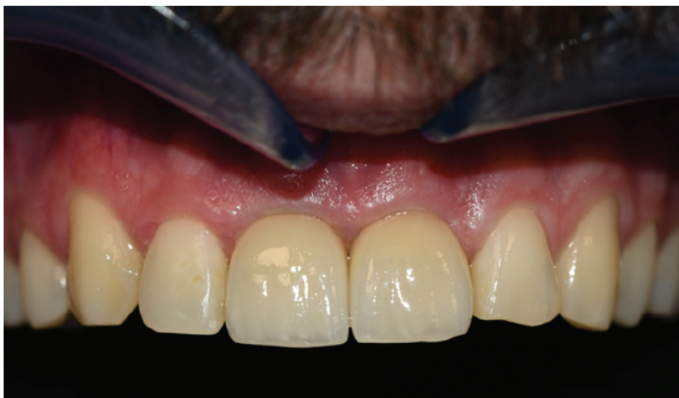
Slika 11. Završna situacija nakon jednogodišnjeg praćenja.