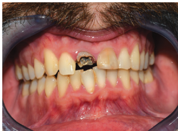
Slika 1. Inicijalna intraoralna situacija.

30 godišnji pacijent je nakon prometne nezgode zadobio frakturu oba gornja prednja inciziva (Slika 1.). S obzirom da su zubi bili endodontski sanirani došlo je do nepovoljne frakturne linije te je bila potrebna ekstrakcija oba zuba. Stoga smo se odlučili na implantoprotetsku rehabilitaciju potpuno digitalnim i navođenim putem kao bi osigurali predvidljivost, preciznost i dugoročnu stabilnost mekih i tvrdih tkiva s obzirom da se radi o estetskoj zoni.