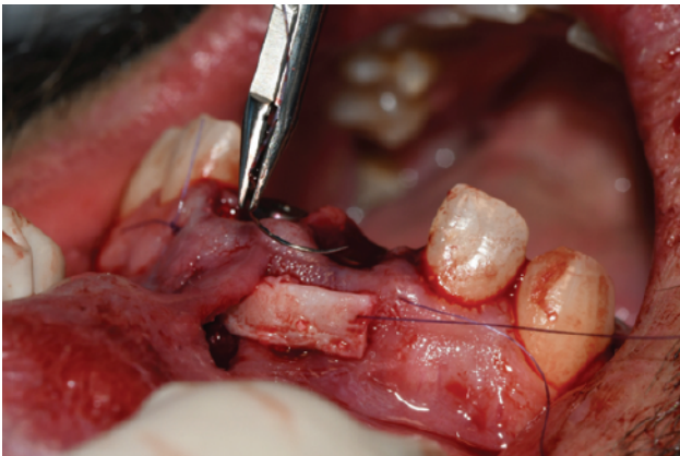
Slika 6. Umetanje vezivno-tkivnog transplantata kroz frenulum.