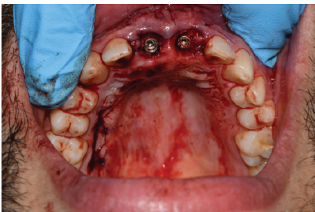
Slika 7. Završni postoperativni izgled nakon "gap managmenta" i vezivno-tkivnog transplantata.