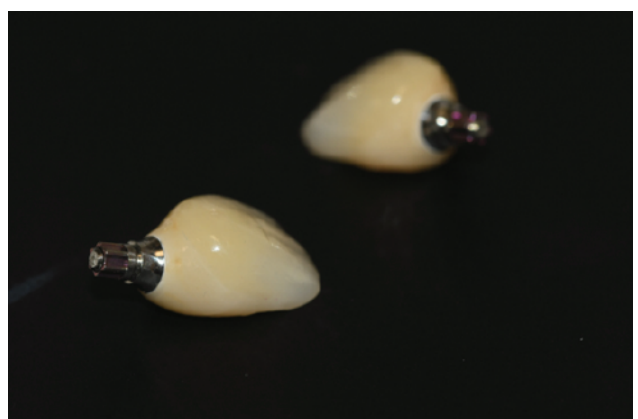
Slika 10. Trajne potpuno keramičke krunice - visokopolirani transgingivalni cirkon I "cut back" tehnika za individualiziranje vestibularnih ploha.