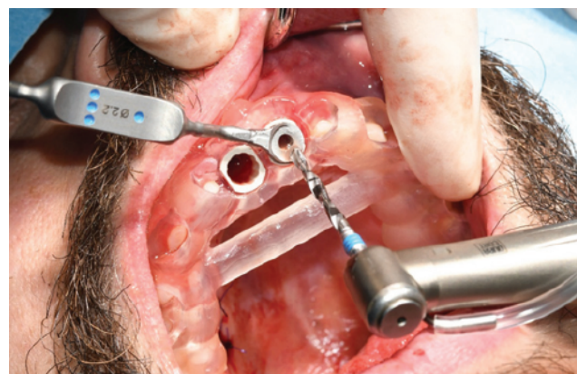
Slika 4. Kirurška šablona in situ i preparacija ležišta implantata.