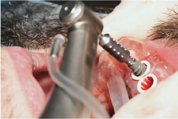
Slika 5. Postav implantata kroz vodilicu.