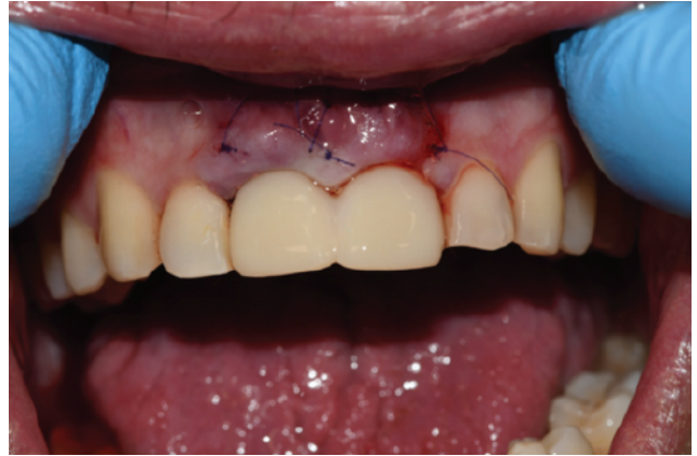
Slika 8. Privremene PMMA krunice dan nakon zahvata.