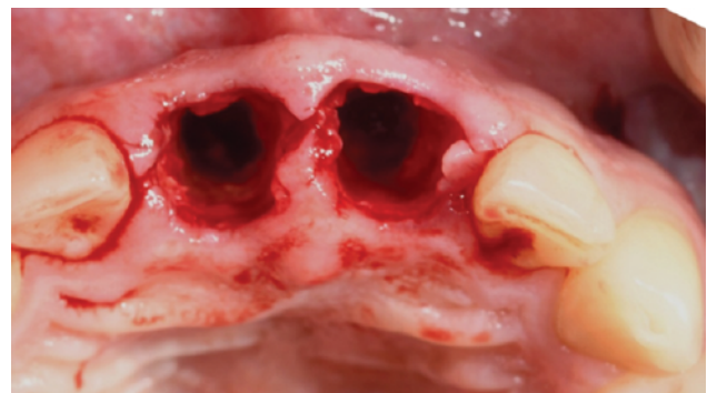
Slika 3. Atraumatsko vađenje bez odizanja mukoperostalnog reznja.

Nakon atraumatske ekstrakcije oba centralna inciziva (Slika 3.), postavljena je kirurška šablona te je nakon provjere dosjeda iste (inspeksijski prozori) odrađena preparacija ležišta oba implantata po zadanom protokolu (Slika 4.). Po preparaciji ležišta postavljene su dentalni implantati Straumann BLX SLActive 4,5 / 14 mm te je postignuta primarna stabilnost (inercijski torque 80 N/cm) (Slika 5.). Nakon postave zaostali i planirani bukalni „gap“ oko oba implantata popunjen je ksenograftom (Straumann Group, Basel, Švicarska), a kako bi se izbjegli vidljivi rezovi tj. ožiljci kroz frenulum gornje usne, isprepariran je polurežanj te umetnut deepitelizirani vezivno-tkivni transplatat (Slika 6.) u svrhu podebljanja i očuvanja, kako kontura alveolarnog grebena, tako i adekvatne horizontalne i vertikalne komponente EBC zone (Slika 7.).