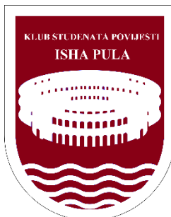
Slika 1. Grb Kluba studenata povijesti ISHA Pula