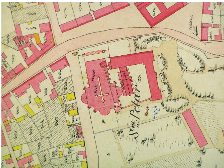
Slika 8. Katastarski snimak biskupskog sklopa iz 1863. godine