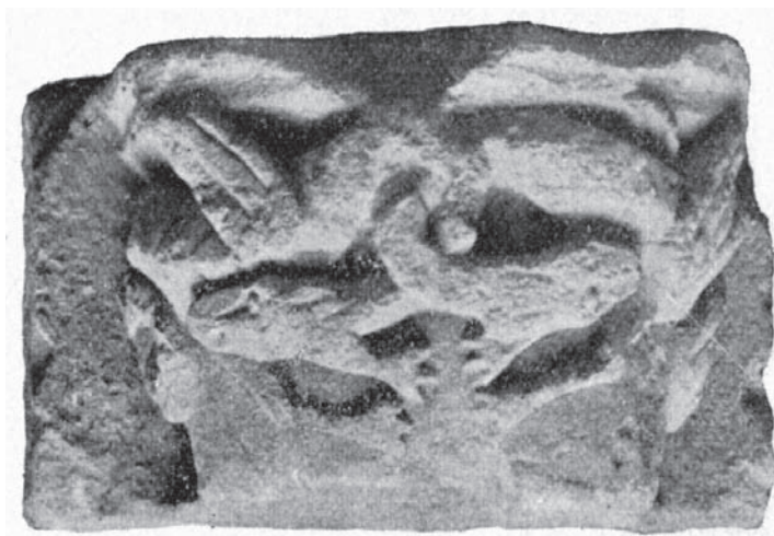
Slika 1. Konzola iz srednjovjekovne đakovačke katedrale

Ukoliko se povuku paralele sa sličnim crkvama u Hrvatskoj i Slavoniji te analiziranjem grafičkog prikaza katedrale nastala nakon oslobođanja od Osmanlija 1697. godine, radilo se o dugoj pravokutnoj, jednobrodnoj crkvi vjerojatno nadstvođenoj samo u svetišnoj zoni. Da je crkva bila nadstvođena cijelom dužinom, zasigurno bi se pronašlo mnogo više kapitela, odnosno konzola, te nekih drugih elementa arhitektonske opreme poput profilacija rebara (Slika 1). Ova građevina nije bila