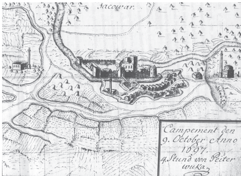
Slika 3. Đakovo nakon oslobođenja od Osmanlija

zidovi su stajali sačuvani gotovo do visine krova. Činjenica da je u prvoj polovini 17. stoljeća služila kao džamija nesumnjivo svjedoči o tome da je prije ovih ratnih zbivanja imala krovšte. Kada je ono uništeno, teško je posve pouzdano kazati. Đakovo je oslobođeno 1687. godine, 37 no 1689. uslijedila je velika osmanska protuofenziva na čelu s vezirom Mustafom Köprilijem u kojoj je ponovno zauzeta Srbija. Stoga su austrijske vlasti odlučile, u nastojanju da spriječe ponovno zadržavanje Osmanlija u Slavoniji i Ugarskoj, „razvaliti“ sve utvrđene gradove, osim Osijeka, Sigeta i Budima. 38 Moguće je da je tada zapaljena i đakovačka utvrda s katedralom, mada se ne može isključiti ni mogućnost da je njezino krovšte, zajedno s ostalim drvenim dijelovima, izgorjelo već u borbama za oslobođenje Slavonije dvije godine ranije.