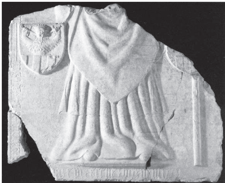
Slika 2. Nadgrobna ploča

majstora izvana ili da je djelo naručeno vani, premda su drugi skloniji tumačenju da se ipak radi o radu domaćeg klesara. 22