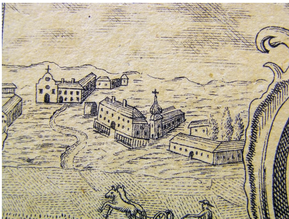
Slika 6. Katedrala i dvor na karti iz 1826. godine

Arhitektonski izgled barokne đakovačke katedrale poznat je danas samo iz šturih slikovnih izvora (Slika 6). Katastarska snimka Đakova iz 1863. godine 70 pokazuje kako se radilo o pravokutnoj izduženoj građevini s odvojenim zvonikom, smještenim sa sjeverne strane biskupskog dvora. 71 U trenutku nastanka ove snimke katedralu su s južne strane podupirale snažne pravokutne kontrafore podignute