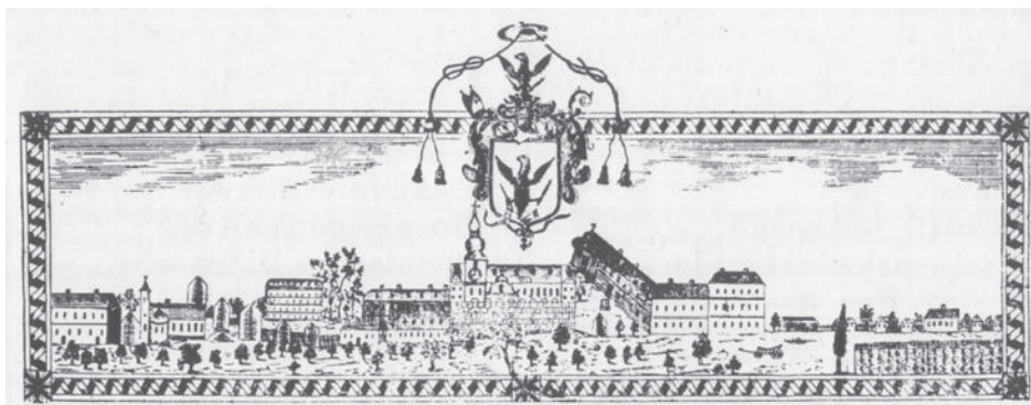
Slika 7. Katedrala i dvor na cehovskom listu

Zaglavlje cehovskog lista Đakova, vjerojatno nastala krajem 18. ili početkom 19. stoljeća, 74 pokazuje da je crkva bila nešto niža od dvora, no viša od srednjovjekovnih zidova biskupskog sklopa (Slika 7). Barokni razvedeni zabat njezina glavnog pročelja, koji je unutar dvorišta biskupskog grada gledao prema zapadnoj strani srednjovjekovnih zidina, svojim gornjim dijelom pokazuje uobičajene odlike provincijskog baroka Slavonije. Zvonik svojim zidanim dijelom bio je negdje u visini vrha krova katedrale. Čini se da nije bio bogato arhitektonski raščlanjen. Na zidanom dijelu tornja stajao je sat, a na vrhu tornja bila je postavljena visoka uobičajena barokna lukovica koja je činila trećinu njegove ukupne visine.